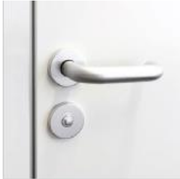
Zweiriegel-WC-Schloss mit Drücker in U-Form aus Nylon, Aluminium oder Edelstahl