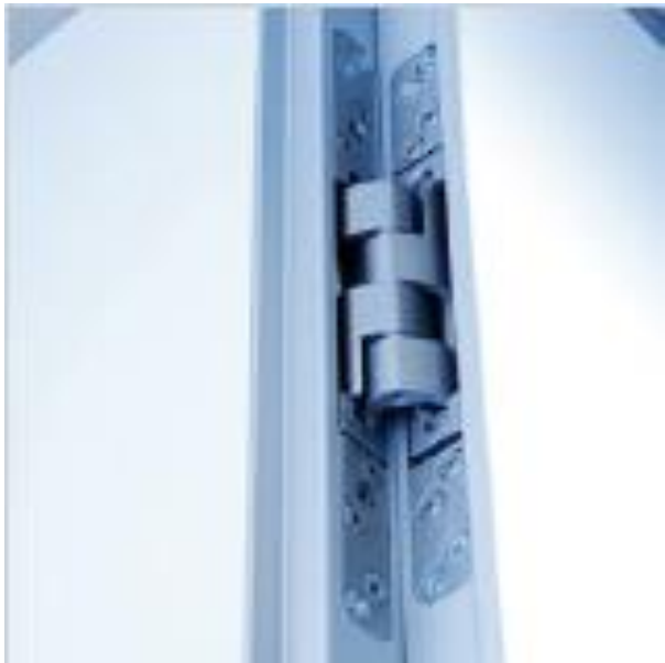
Verdeckt liegendes Band, flächenbündig in Wand- und Türelement integriert