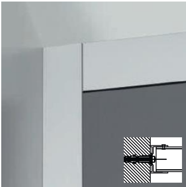
Maueranschlüsse durch U-Profile zum Ausgleich von Bautoleranzen