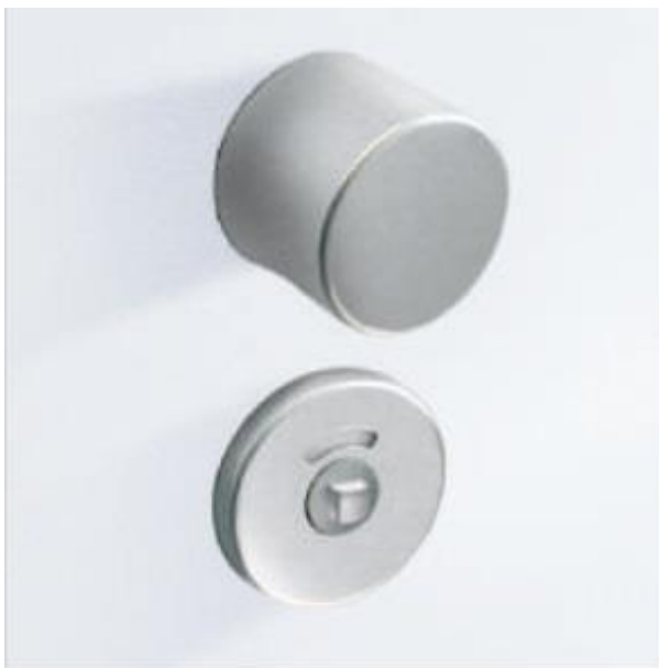
Einriegel-Schloss mit Zugknöpfen aus Nylon, Aluminium oder Edelstahl.