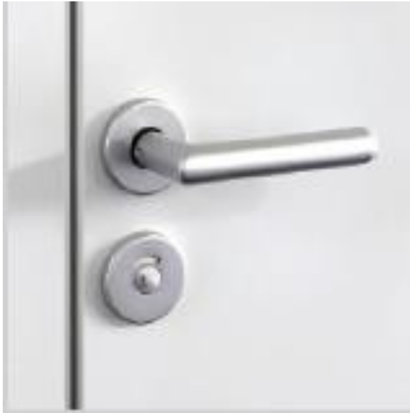
Zweiriegel-WC-Schloss mit Drücker in L-Form aus Aluminium oder Edelstahl