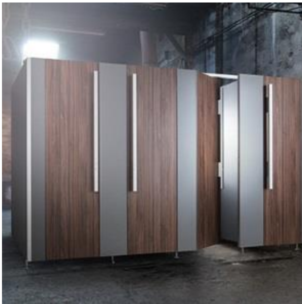
Schwebend: Füße und Stabilisator in den Zwischenwänden