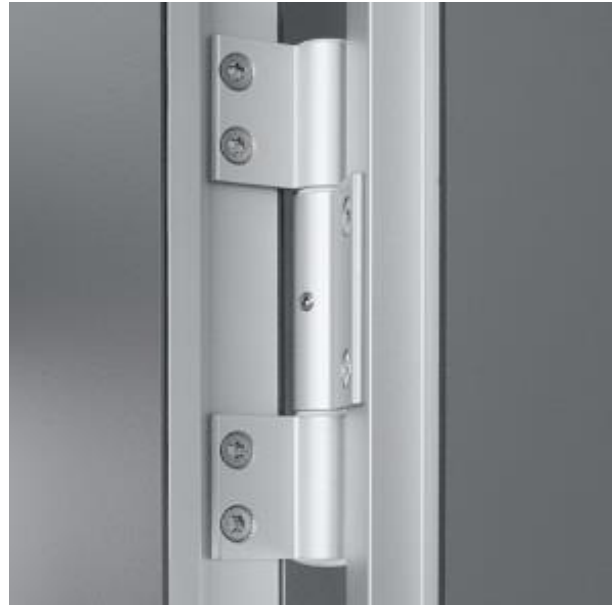
cerniera speciale tripla in alluminio con molla per una chiusura o apertura automatica