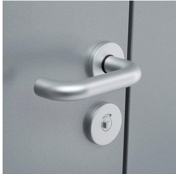
serratura WC a due mandate con maniglia a U in nylon, alluminio anodizzato o acciaio Inox