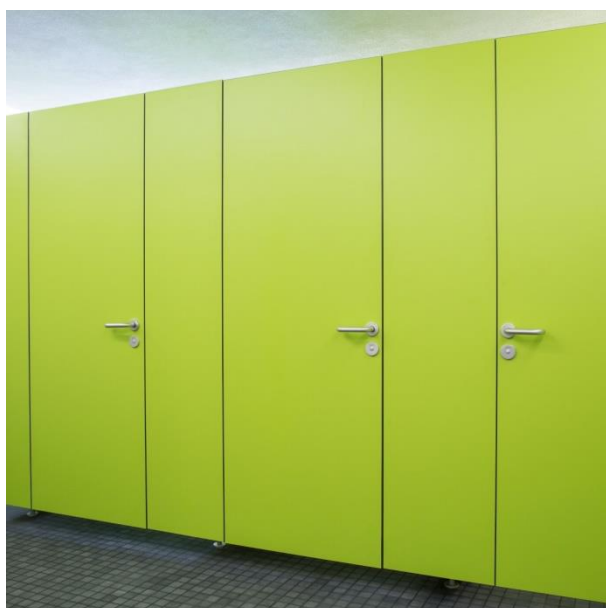
pedini e profilo stabilizzatore arretrati di mm 150, pedini sotto pareti divisorie