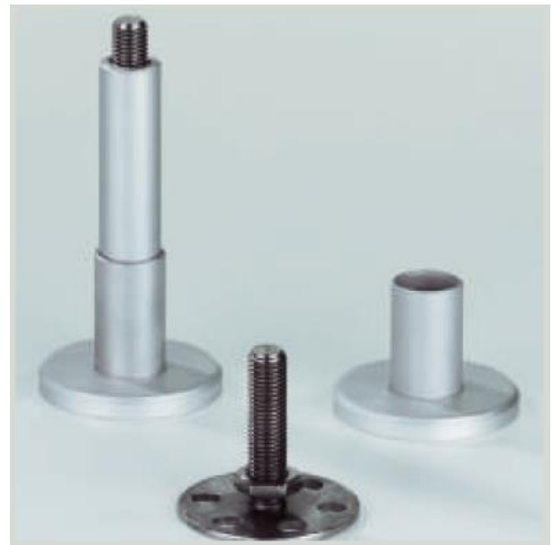
dettaglio pedino - anima e piastra in acciaio Inox con rosetta di copertura paracolpi