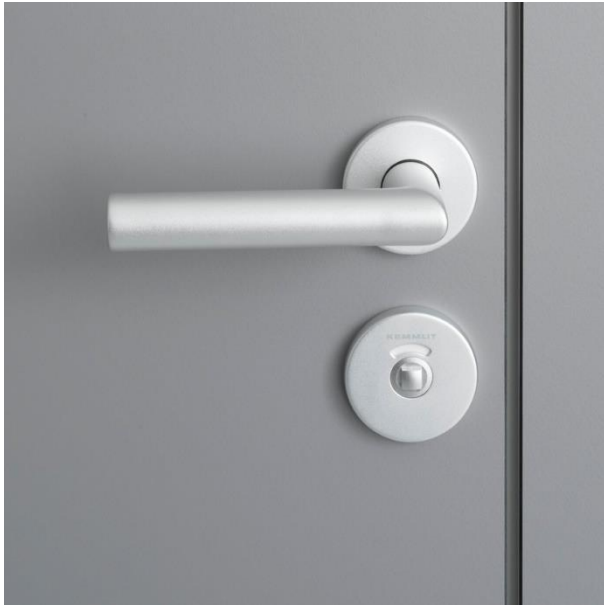
serratura WC a due mandate con maniglia a L in alluminio anodizzato o acciaio Inox