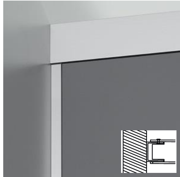
raccordo a muro con profilo in alluminio massiccio che forma un'elegante fuga per compensare eventuali tolleranze