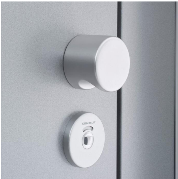
serratura ad una mandata con pomolo in nylon, alluminio o acciaio Inox