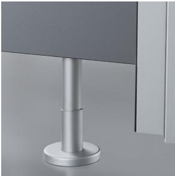
pedino in alluminio anodizzato o acciaio Inox per luce inferiore mm 80-215