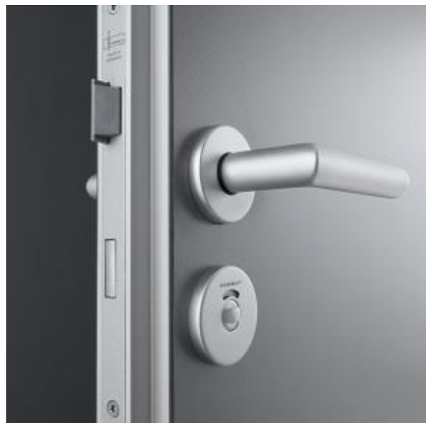
serratura WC a due mandate con chiavistello in metallo e scrocco antifrizione in metallo per una chiusura silenziosa della porta