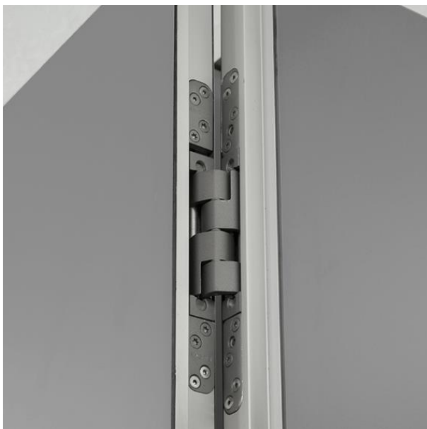
cerniera nascosta montato a filo negli elementi porta e parete