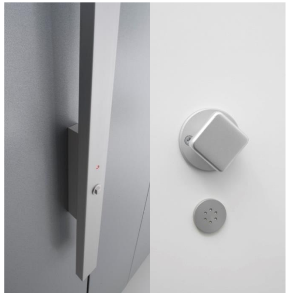
serratura ad una mandata con maniglione verticale in alluminio massiccio