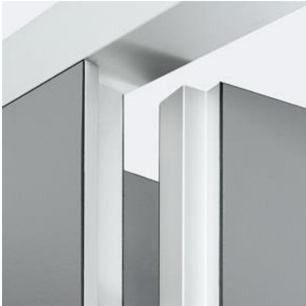
pareti e porte con cornice perimetrale in alluminio , porte con battuta a gradino