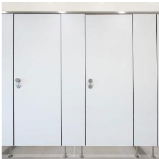
pedini e profilo stabilizzatore a filo con parete frontale